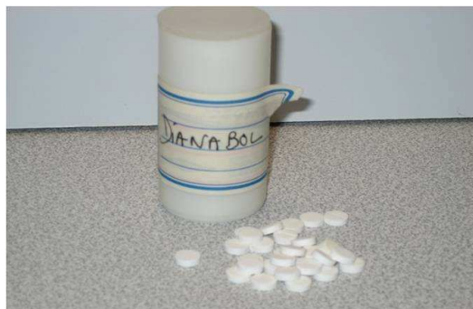
L'identification du produit : pas toujours évident !