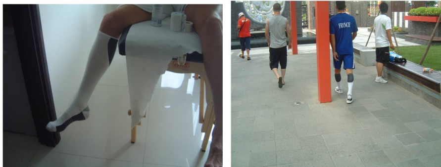
Chaussettes de récupération

Dans la pratique, 469 paires de chaussettes de voyage et autant de paires de chaussettes de récupération utilisées après l'entraînement ou lors de déplacements dans le village olympique nous ont été fournies par notre partenaire.